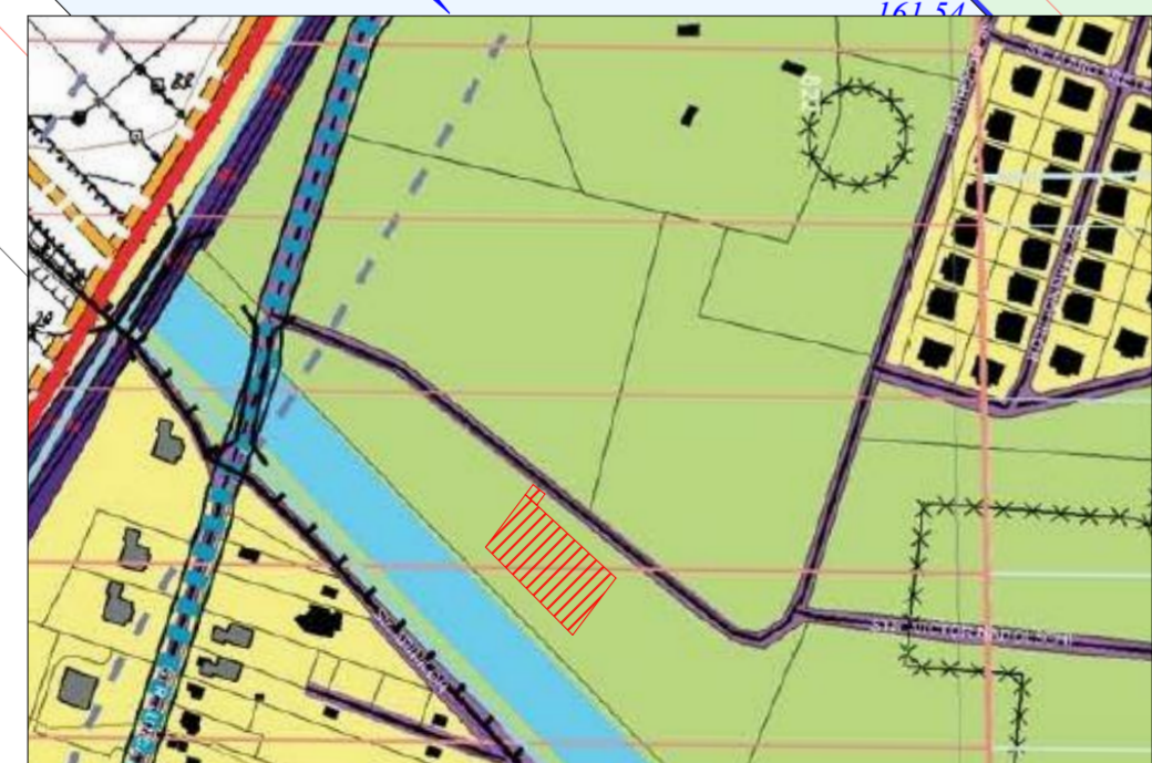
EXTRAS P.U.G. MUNICIPIUL BACAU