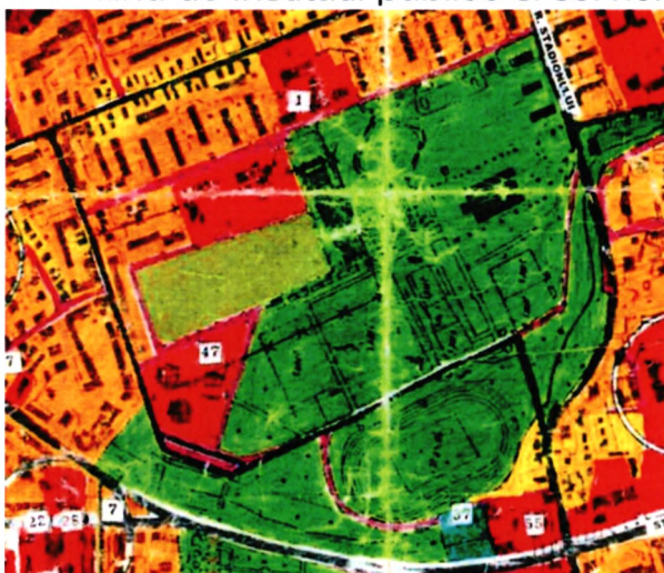
Detaliu PUG Bacau 2000

Terenul aferent PUZ nu are functia urbanistica de spatiu verde agrement sport in PUG 2012 si nu-l avea nici in PUG 2000, functiunea urbanistica fiind de Institutii publice si servicii