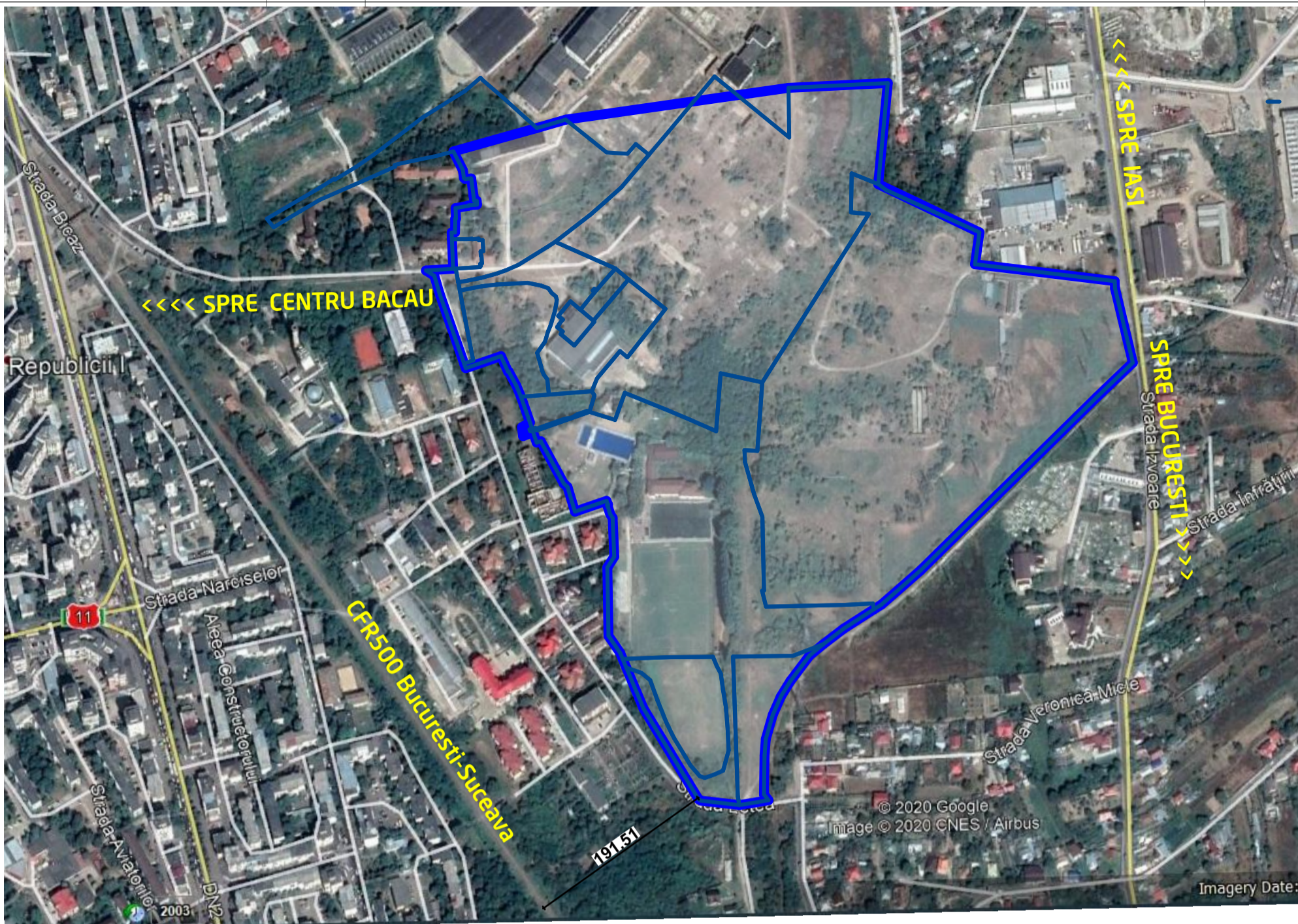
1 vedere satelit - Google Earth 1:5000