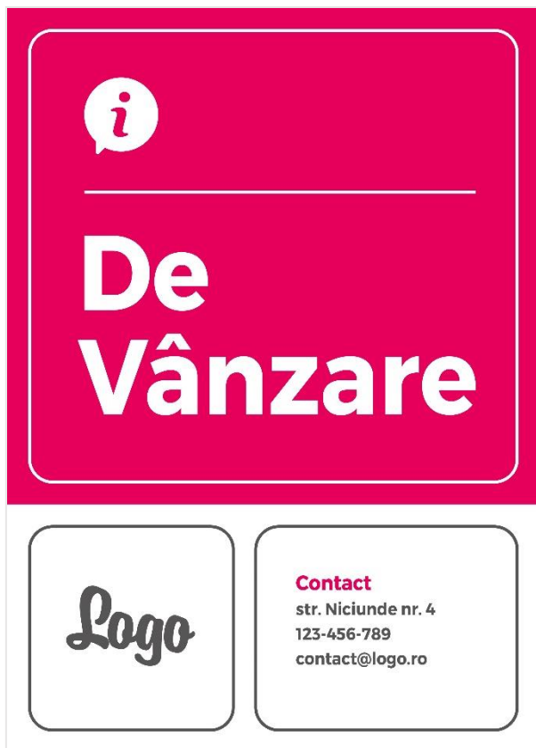
varianta 1 – Portret